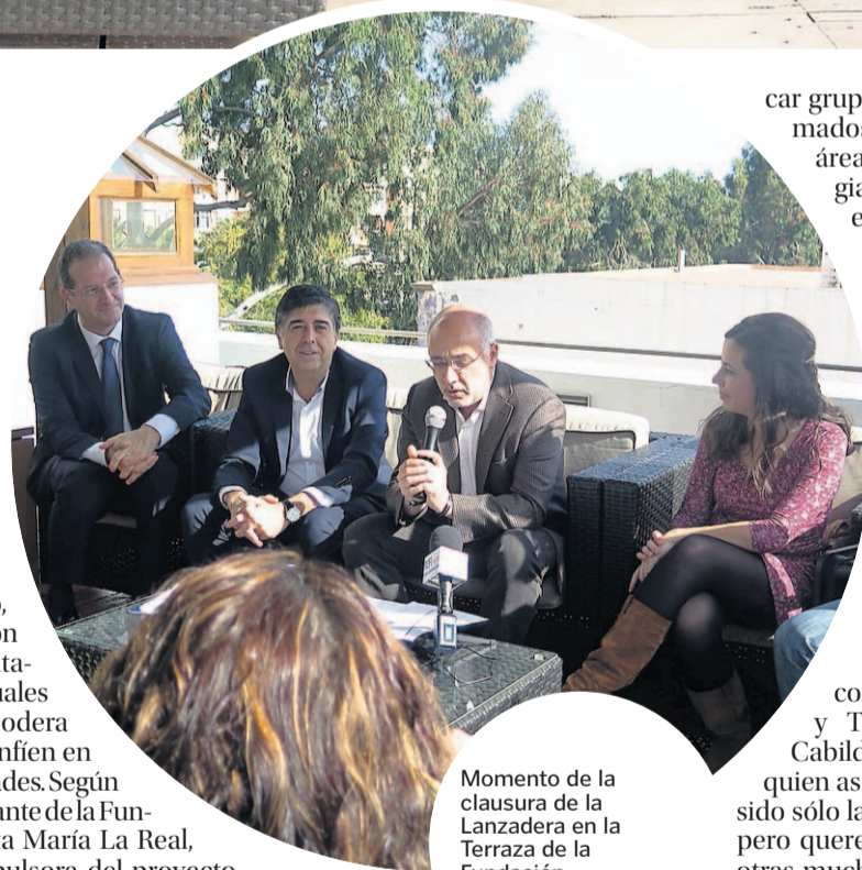
Momento de la clausura de la Lanzadera en la Terraza de la Fundación Universitaria.

Esta es la segunda edición en Gran Canaria y ha contado con la participación de Telefónica a través de su Fundación, y del Cabildo Insular. Lo que diferencia a este formato es que se pone el foco en las personas, se busca la conexión emocional para sacar lo mejor de ellas y que se sientan más fuertes a la hora de buscar empleo. Según el responsable de proyectos socia-